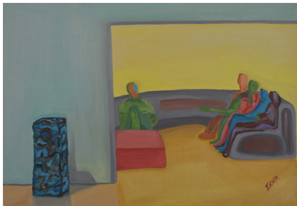
La Sociedad Burbuja: Öl auf Leinwand, 70 x 100 cm, 2024