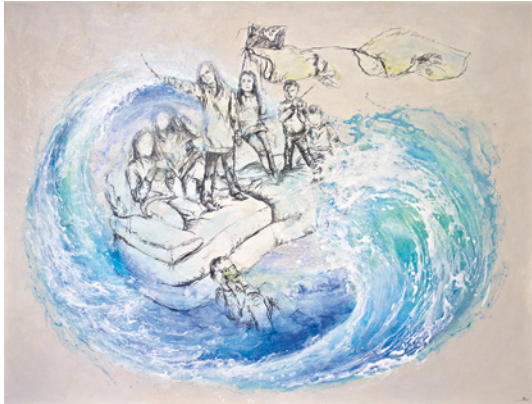
„Bieberpiraten“, Kohle und Acryl auf Leinwand, 130 x 170 cm, 2025