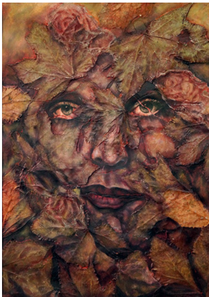
„Gesicht“, Ölpastell/Gouache, 2023

Vita: 1953 geb. in Hannover, Studium Freie Kunst an der Fachhochschule für Kunst und Design in Hannover, Leben und Arbeit als Freischaffende Künstlerin in Hannover. Einzel- und Gruppenausstellungen seit 1990. Seit 2002 jährliche Teilnahme an der Aktion „Lister Künstler“ Atelierrundgang. Seit 2008 Teilnahme am 1 x jährlich stattfindenden „Zinnober“ Wochenende. Von 2014 - 2022 Lehrauftrag für Aktzeichnen an der Hochschule Hannover.