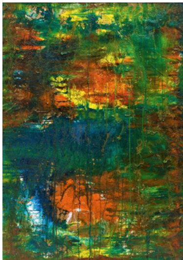
Öl auf Pappe, 127 x 90 cm

Lamazza zeigt mit seinen Bildern, wie groß die Ausdrucksfähigkeit von Farben sein kann. Die Werke zeigen eine überreiche „lichtdurchdrungene“ Farbpalette, in der grelle metallische Töne die positive Aggressivität des Pinselstriches unterstreichen. Neben den Gemälden sind auch die Collagen ein Freudenakt, eine Liebeserklärung an das Leben. Sie ziehen den Betrachter unwiderstehlich in Traum- und Erlebniswelten ein.