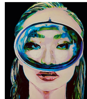
„My Space“ 2025, mixed media, 80 x 60 cm (Bildausschnitt)