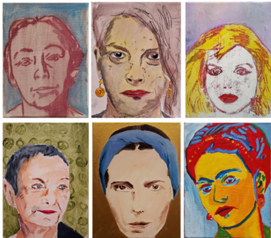
Mind. 48 Porträts , Mischtechnik auf Leinwand, je 18 x 24 cm, 2018 – 2025

Myller hat in zahlreichen Ausstellungen in Kunstvereinen, Galerien und Museen in Städten wie Hannover, Berlin, Köln, Hamburg, Leipzig, Bremen, Weimar, Wiesbaden, San Francisco, Barcelona, Toulouse, Hämeenlinna (Fin) und Jaromerice (Tschechien) ausgestellt. Er ist Mitglied im Bundesverband Bildender Künstler (BBK) und in der Fachgruppe Kunst von Ver.di. Er hat mehrere Auszeichnungen für seine Arbeiten erhalten und war bei mehreren Kunstpreisen in der Vorauswahl.