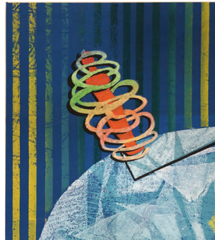
„Schiefloge“, Maße 105 x 90 cm, Siebdruck

Vita: Holle Voss ist seit 2016 Mitglied der Lister Künstler. Geboren in Hannover; Studium für Textildesign an der Werkkunstschule Hannover und Studium der Kunstpädagogik; Gründungsmitglied des Workshop Hannover; Kunsterzieher-tätigkeit an Real- und Grundschulen in Hannover von 1979 bis 2005; seit 1989 experimenteller Siebdruck; Fortbildung in Hamburg und Trier.