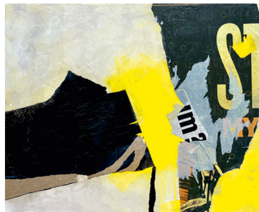
„Abstract crossover“ , Kasein und Collage, 120 x 100 cm, 2024

Vita: Freischaffende Malerin aus Hannover, Unterricht bei zahlreichen europäischen und amerikanischen Künstler:innen, Ausstellungen in Hannover, München und USA, Mitglied der Lister Künstler:innen Hannover.