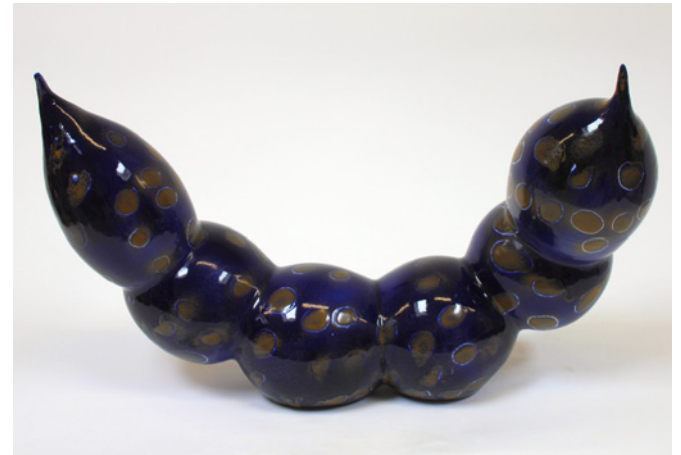
„Vasa Pretiosa 46“, Keramik, Fayencemalerei, 73 x 45 x 20 cm, 2023

Vita: Geboren 1958 in Frankfurt am Main, 1978 Mitglied einer Künstlerkommune in der Nähe von Frankfurt/M. - Fotografie, Malerei, Musik, Keramik. Danach Schwerpunkt Keramik, Einzelstücke, Geschirr, Baukeramik und Keramikmöbel. Ab 1990 Malerei auf Keramik, Leinwand und Digital. 2000 Entstehung der Netzwerkbilder, Workshops in ganz Deutschland, Ausstellungen in Deutschland, Österreich, Italien und Kroatien. Heute Schwerpunkt Baukeramik, Skulpturen, Wandreliefs.