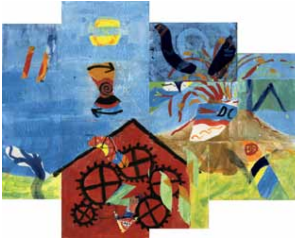
▲ Netzwerkbild DB Energie · ca 1,5 x 1,2 m · 11 Teilnehmer