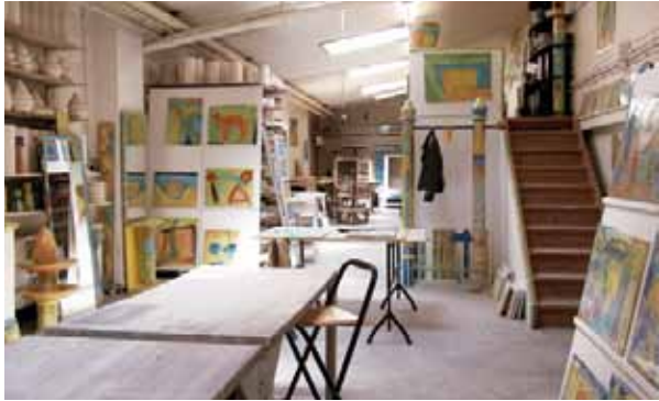
Das Werkstatt-Atelier in der Goebenstraße, Hannover-List

Anschließend wird die Latexschicht entfernt und bringt die individuellen Motive als grundlegender Bestandteil des Gesamtkunstwerks wieder zum Vorschein. Ein Netzwerkbild besteht, ebenso wie das Team, das es erschaffen hat, aus vielen individuellen Aspekten, die einen komplexen gemeinsamen Ausdruck gefunden haben.