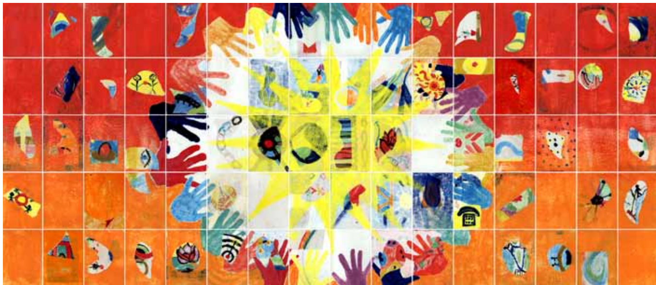
▲ Eines von zehn Netzwerkbildern der EWE Tel GmbH · XX x XX m · Workshop mit 1440 Teilnehmern.